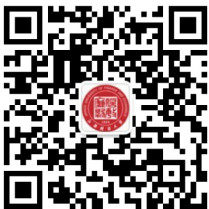
“江西财经大学图书馆”微信公众号二维码

进入图书馆主页，鼠标滑行到主页中部“数字资源”下“随书光盘”，点击“随书光盘”，进入“博云非书资料管理系统”，在检索框中输入书名进行检索，查询到有记录时，点击进入，下载即可。