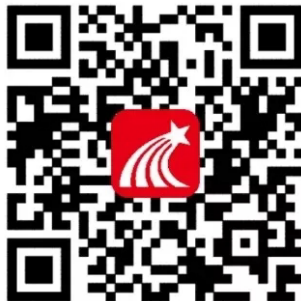
超星学习通（移动图书馆）二维码